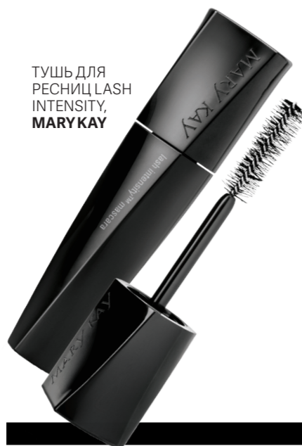
ТУШЬ ДЛЯ РЕСНИЦ LASH INTENSITY, MARY KAY

Яркая помада – это превосходный способ акцентировать внимание на губы. А с новым матовым тинтом Pure Lust Extreme Matte Tint от Cailyn правильно накрасить губы стало еще проще – его водостойкая формула обеспечит тебе гладкое, равномерное покрытие и выразительный цвет аж до 10 часов.