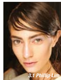
3.1 Phillip Lim

Для эффекта мокрых волос, как будто вы только что вышли из пучины морской, вместо фиксирующих пенек используйте масло для волос или легкие стайлинги.